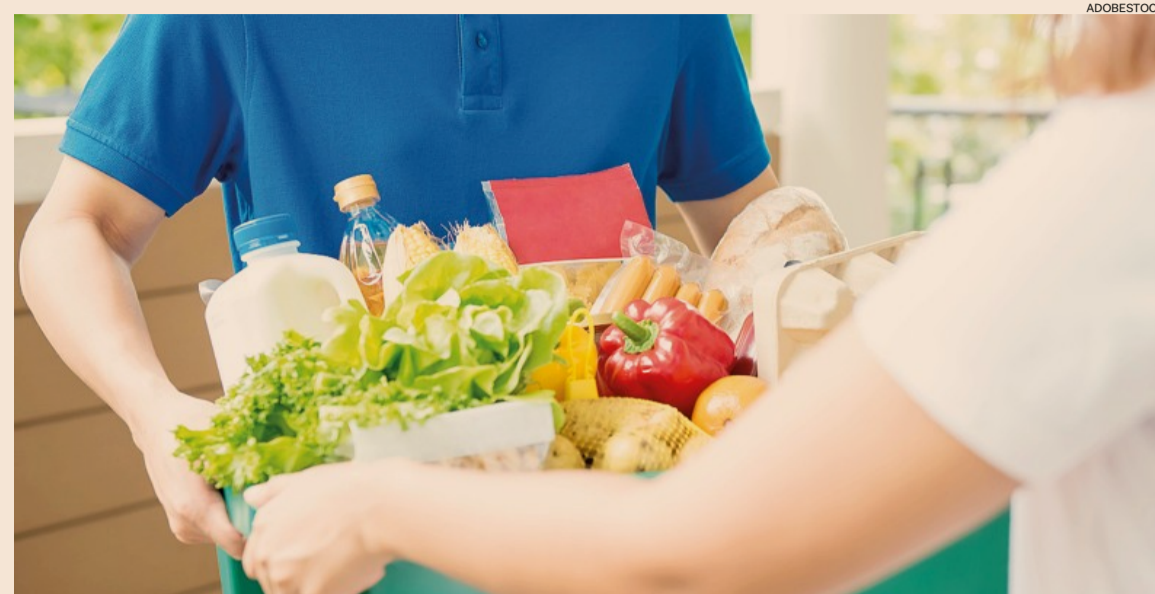
Consegne a casa. Nel 2020 gli acquisti online dei consumatori italiani avranno una crescita del 55% rispetto al 2019; per l'87% saranno nell'alimentare

Food & Made in Italy il 9 luglio dalle ore 10